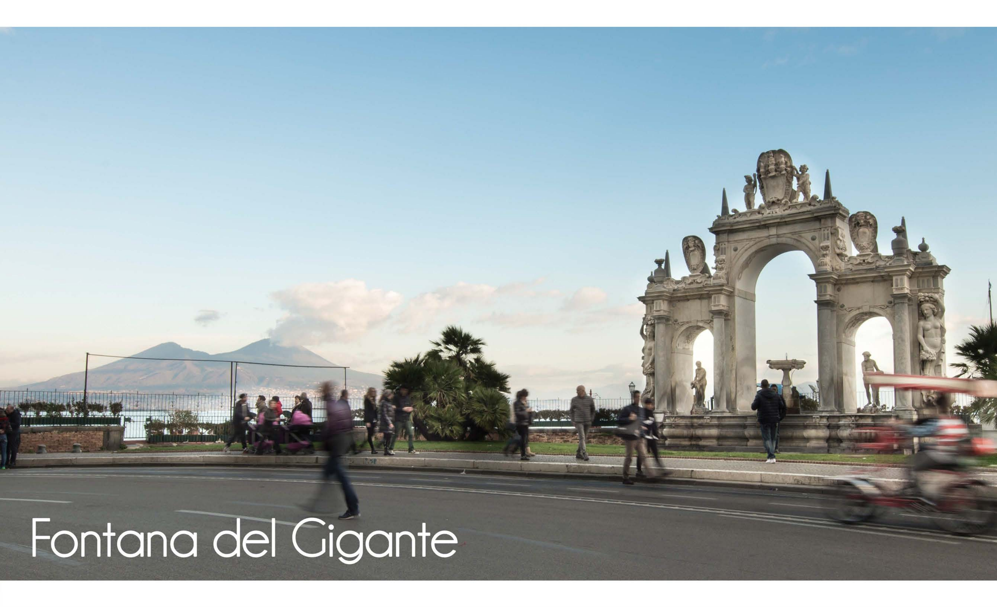
Fontana del Gigante